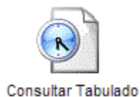
Figura 9. Icono Consultar Tabulado

Para hacer uso de la segunda opción, usted debe ingresar al sistema; Una vez ingrese al sistema, haga clic en el icono " Consultar Tabulado " que se encuentra en el Panel de Control (Figura 9)